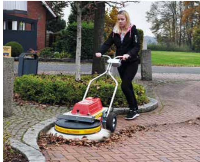
Wandbündiges Fegen: Gelangt bis an die Kanten und fegt jede Ecke gründlich aus.