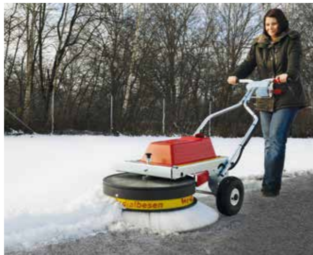
Gut gerüstet für jede Jahreszeit, selbst Schnee wird im Nu zur Seite geräumt.