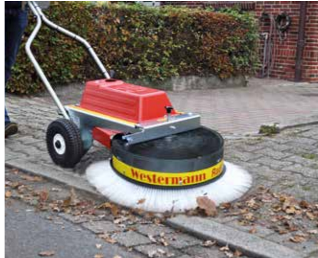
Reinigt selbst unebene, schwierige Untergründe gekonnt und überzeugend.